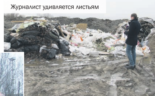
Журналист удивляется листьям

бы успокоить продолжающих бомбить инстанции граждан, администрация Красносельского района поспешила сообщить, что в октябре текущего года внесла данный объект в перечень мест незаконного скопления отходов (под № 29, между прочим) и теперь намерена время от времени наезжать сюда для контроля. Правда, только в рабочее время, о чём перевозчики, конечно, уже прознали, и гонят сюда грузовики преимущественно ночью. Но ничего, раз свалка включена в перечень, район рано или поздно будет её ликвидировать – но уже за счёт налогоплательщиков. А это, как известно, деньги немалые. Сумма, с учётом расходов на проектирование, может составлять до 100 млн. руб., и вся фактически из наших карманов. Так что на этом заработает, и совершенно законно, ещё немало дельцов и чиновников.